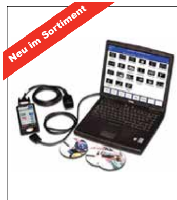
T4 Lite Diagnostic Kit

Für Preisankünfte bezüglich T4 und T4-Zubehör wenden Sie sich bitte an Ihren XPart Händler.