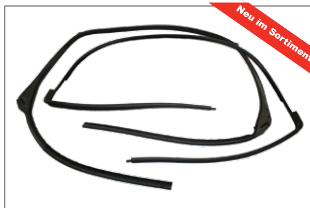
MGF und MGTF Dichtungskit CFE000300

Kit Teilenummer: CFE000300 (vordere und hintere Dichtung). UPE: € 199.99 + MwSt