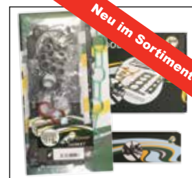
ZUA001580 MLS Head Set

Das Set enthält hochwertige Komponenten, ist aber trotzdem preisgünstig, so wie Sie es von XPart erwarten: Verkaufspreis nur €97,50 +MwSt (UPE)