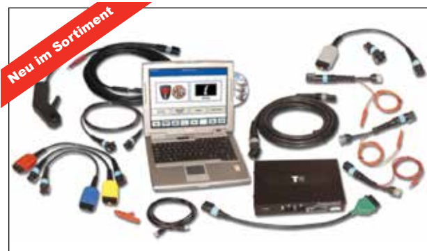
Full T4 Diagnostic Kit